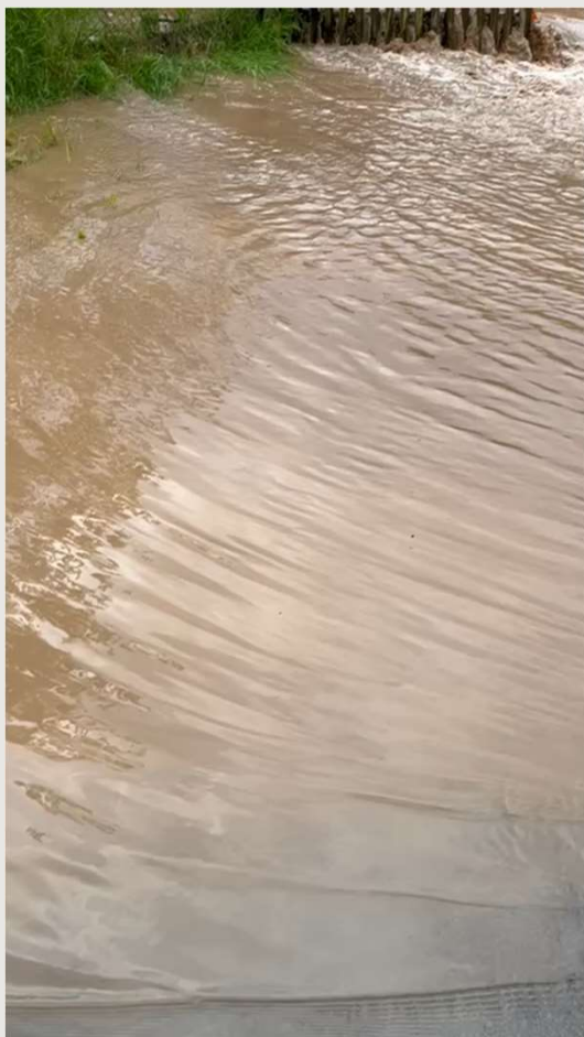
Überschwemmung in Zillbach