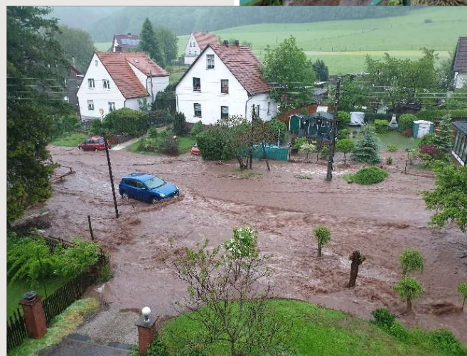
Überschwemmung in Mosbach